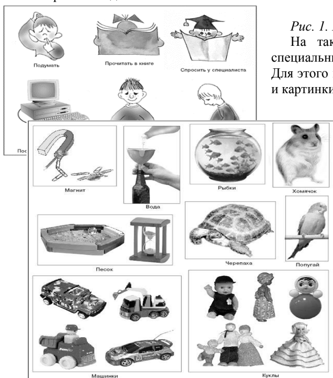
Рис. 1. Карточки с изображением методов исследования

Для проведения тренировочных занятий понадобятся карточки с символическим изображением «методов исследования». Образцы карточек представлены на рис. 1. Сделать такие карточки можно из обычного тонкого картона. Оптимальный размер карточки — половина обычного альбомного листа (1/2 формата А4). Изображения лучше всего выполнить из цветной бумаги и наклеить на картон. На обратной стороне каждой карточки надо написать словесное обозначение каждого метода.